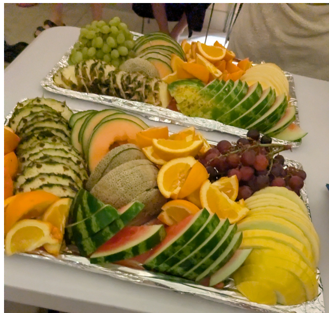
I pauserne kan gæsterne nyde lækker frugt og sprøde nødder.