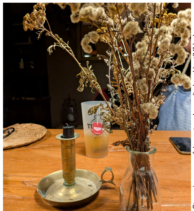
Stemningen er afslappet og hyggelig hos Heat'N'Herbs