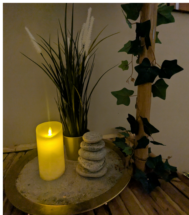
Lys og planter skaber en hyggelig stemning.

Efter et par minutter brydes stilheden. De fleste skynder sig ind i varmen. De modigste lægger sig i den urørte sne og tegner engle med kroppen. Sneen knitrer mod huden. Åndedrættet står som røg i luften. Jeg fryser - og føler mig samtidig mere levende end længe.