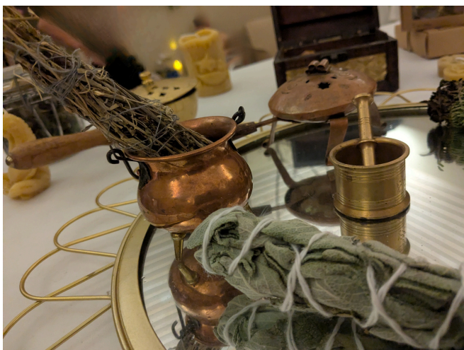
Rummet er pyntet med ceremonielle urter og kviste.

Gæsterne er ankommet. De fleste bærer saunahue med rank ryg. Mønstrede, sribede, enkle og farvefyldte fildede hatte hviler på hovederne af smilende, forventningsfulde ansigter.