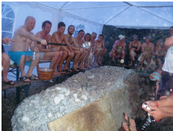
Danmarks første teltrøgsauna!