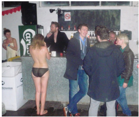
Den fri dresskode gav sig pudsige udslag!