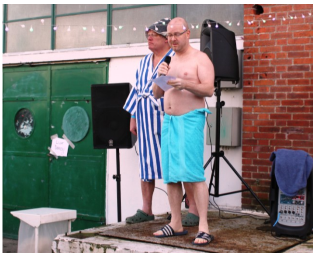
Ministerråd Tito Gronow fra Finlands Ambassade holder åbningstale.