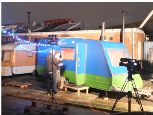
TV 2 Lorry var på pletten midt under opbygningen.