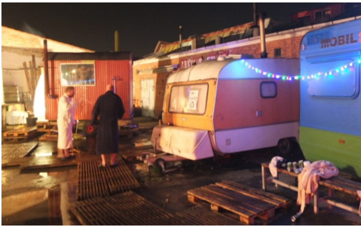
PB 43's 2 mobile saunaer og gangbroer imellem.