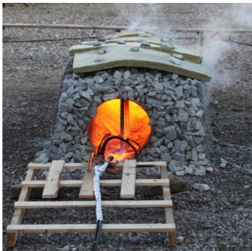
Varmluftballonbrænderen i funktion!

Foruden de 6 saunaer, var der også 2 vildmarksbade, et kæmpestort 10.000 liter koldtvandskar til afkøling (+ 3 brusere med koldt vand) og et lille transportabelt SPA bad inde i hallen, hvor baren serverede kolde drinks, øl og vand også til indvortes afkøling. Alt i alt et vellykket arrangement med mange glade og tilfredse mennesker. Eventen løb stort set rundt økonomisk og vi har da fået 3-4 nye medlemmer ud af vores anstrengelser.