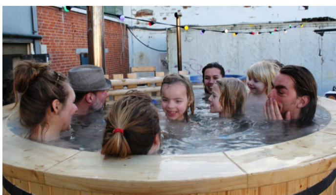
Vildmarksbadene var også populære.