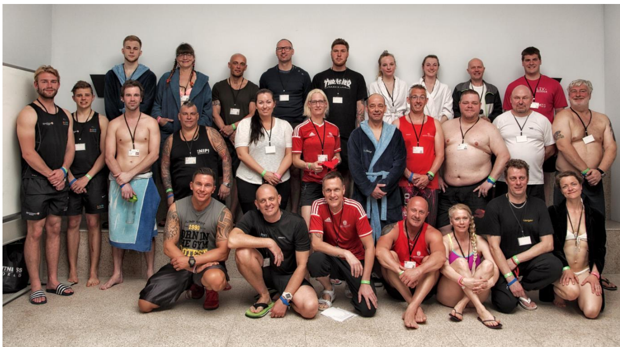
Her er de fleste af gusmestrene, det var nemlig lidt svært at få samling på tropperne!!